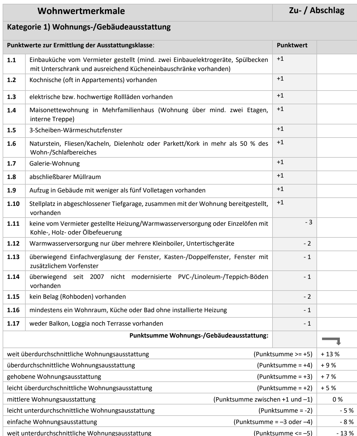
Tabelle 2: Weitere Wohnwertmerkmale, die den Mietpreis signifikant beeinflussen